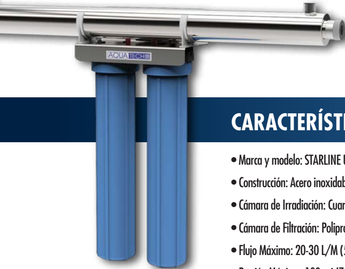
UV-30-2 WATER PURIFICATION SYSTEM